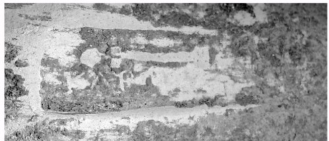
Imatge de la marca ròdia MCT'10.UE-6074.04 (dibuix i foto: Núria Romaní).

És interessant que una de les marques d'àmfora ròdia ha aparegut en un nivell de construcció de l'edifici de Can Tacó. Això ha fet reconsiderar la data inicial del jaciment i situar-lo clarament pels volts del 150 aC, mentre que fins ara se situava en el darrer terç del segle II aC.