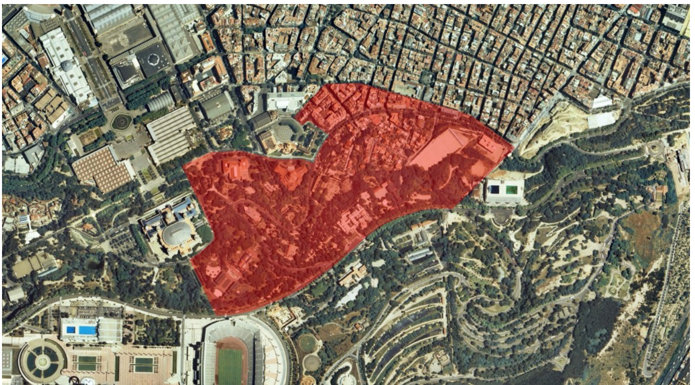
Delimitació de la zona estudiada sobre el terreny.

El llibre ofereix material gràfic inèdit amb reconstruccions històriques molt ajustades a l'estat de la recerca per a les fases romana, tardoromana i medieval. A més, es presenta en tres llengües —català, castellà i anglès— i en format digital, que es pot descarregar gratuïtament ( aquí i al repositori obert de l'Ajuntament de Barcelona ).