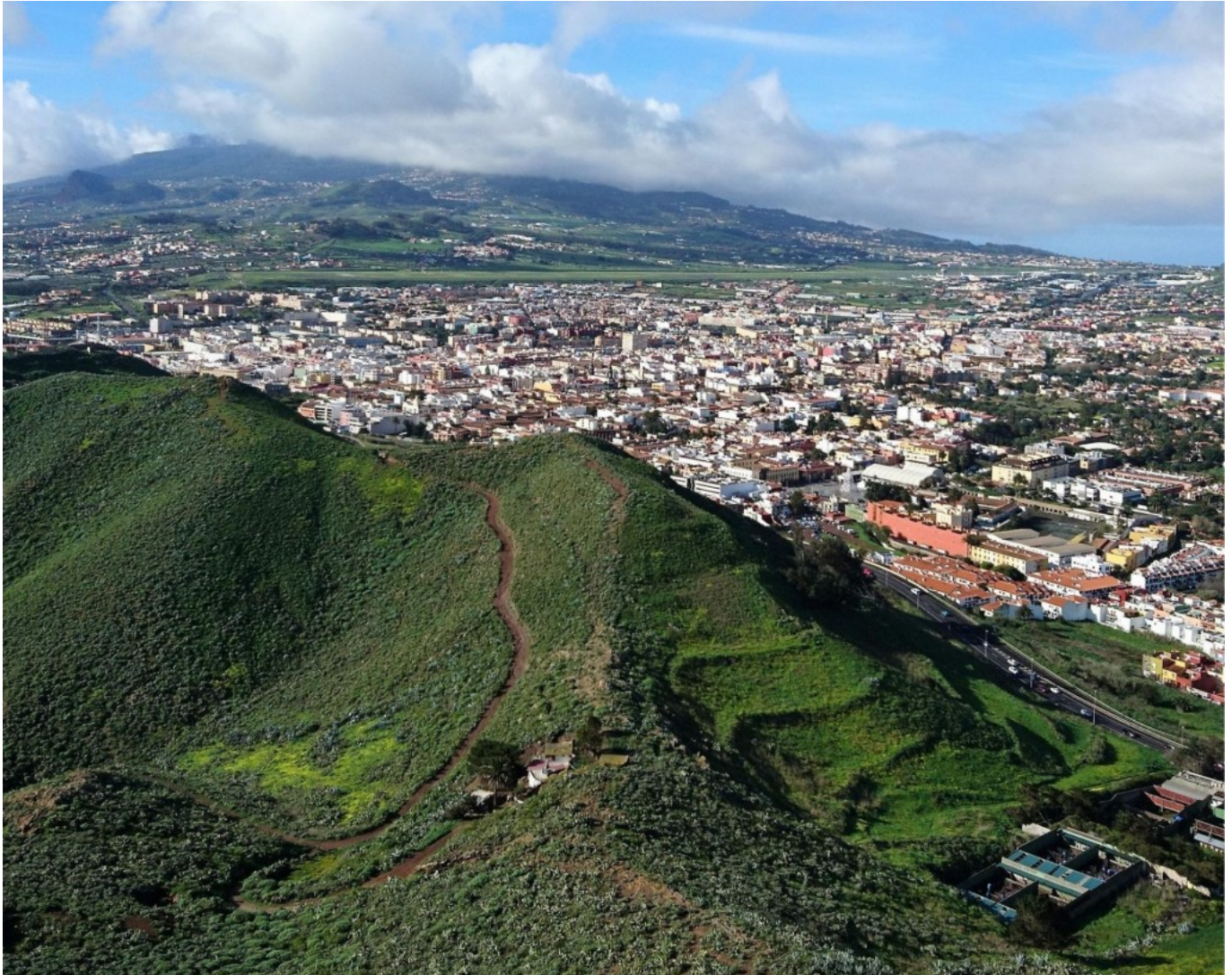
Vista de San Cristóbal de La Laguna des d'una talaia històrica.

“Durant segles, la xarxa de talaies va ser la primera línia de defensa de l’illa contra pirates, corsaris o enemics de la corona. Les persones que treballaven com a vigilants eren pastors i agricultors, i mantenien les seves activitats agropastorals mentre estaven de servei. Com a resultat, moltes ubicacions de talaies estan associades a impressionants restes etnogràfiques, com cabanes i terrasses de conreu. Així, estem estudiant la configuració dels paisatges culturals de Tenerife en l’època dels inicis del colonialisme”, conclou Jared Carballo (ULL).