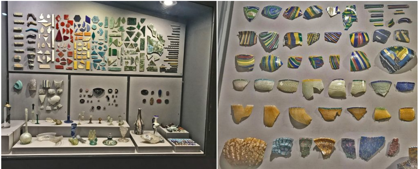
Alguns vidres acolorits de la Col·lecció Gorga situada al Museo Palazzo Altemps a Roma.

En els darrers anys, un estudi aprofundit dels vidres Gorga ha permès localitzar materials similars en museus i col·leccions d'arreu del món com ara el Museu del Vetro (Venècia, Itàlia), el Victoria & Albert Museum i el British Museum (Londres, Regne Unit), el Corning Museum of Glass (Corning, Nova York, EUA), el Metropolitan Museum of Art (Nova York, EUA), el Toledo Museum of Art (Toledo, Ohio, EUA) i les col·leccions Sangiorgi i Morgan.