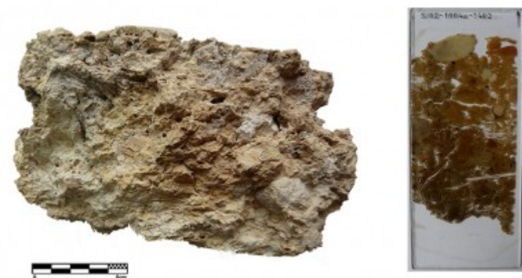
Fragment de sostre de fang del jaciment de Sant Jaume - Mas d'en Serrà (Alcanar, Montsià).