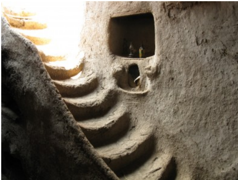
Exemple actual de casa de toves a Egipte.

7. Aportes etnoarqueológicos al estudio de la arquitectura doméstica de adobe. María Correas-Amador (investigadora independent).