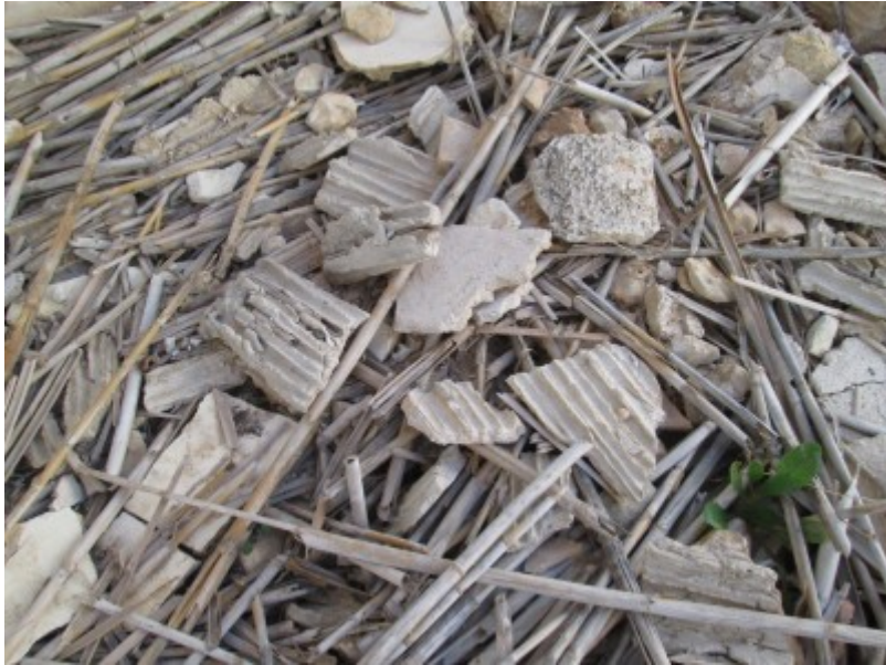
Restes constructives en una construcció recent enderrocada.