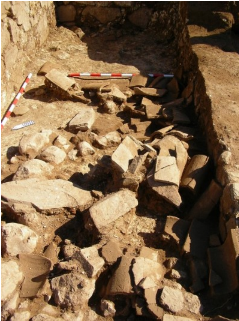
Enderroc de teules de Can Tacó. Foto: Equip Can Tacó (2020).

4. Arqueologia i arqueometria. Potencial i aportacions a l'estudi d'elements constructius de dos assentaments de la primera romanització (s. II aC). Esther Rodrigo (Universitat Autònoma de Barcelona, UAB), Núria Romaní (ICAC-UAB) i Anna Gutiérrez (ICAC).