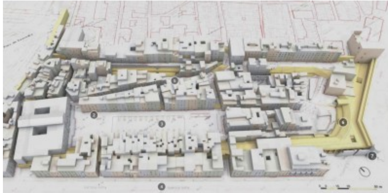
Circ romà de Tarragona. Mostra model mapa de punts obtingut a partir de l'escàner làser.