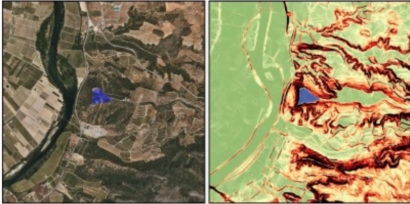
Exemple d'aplicació GIS a l'estudi de fortificacions. Castellet de Banyoles de Tivissa.