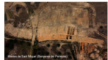
Masies de Sant Miquel (Banyeres del Penedès)