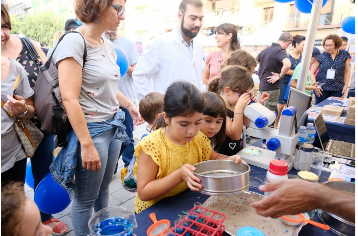
Imatge d'un dels tallers que es van poder fer a la Nit de la Recerca en l'edició de 2021.

donar a conèixer la recerca i la innovació en un llenguatge planer i comprensible.