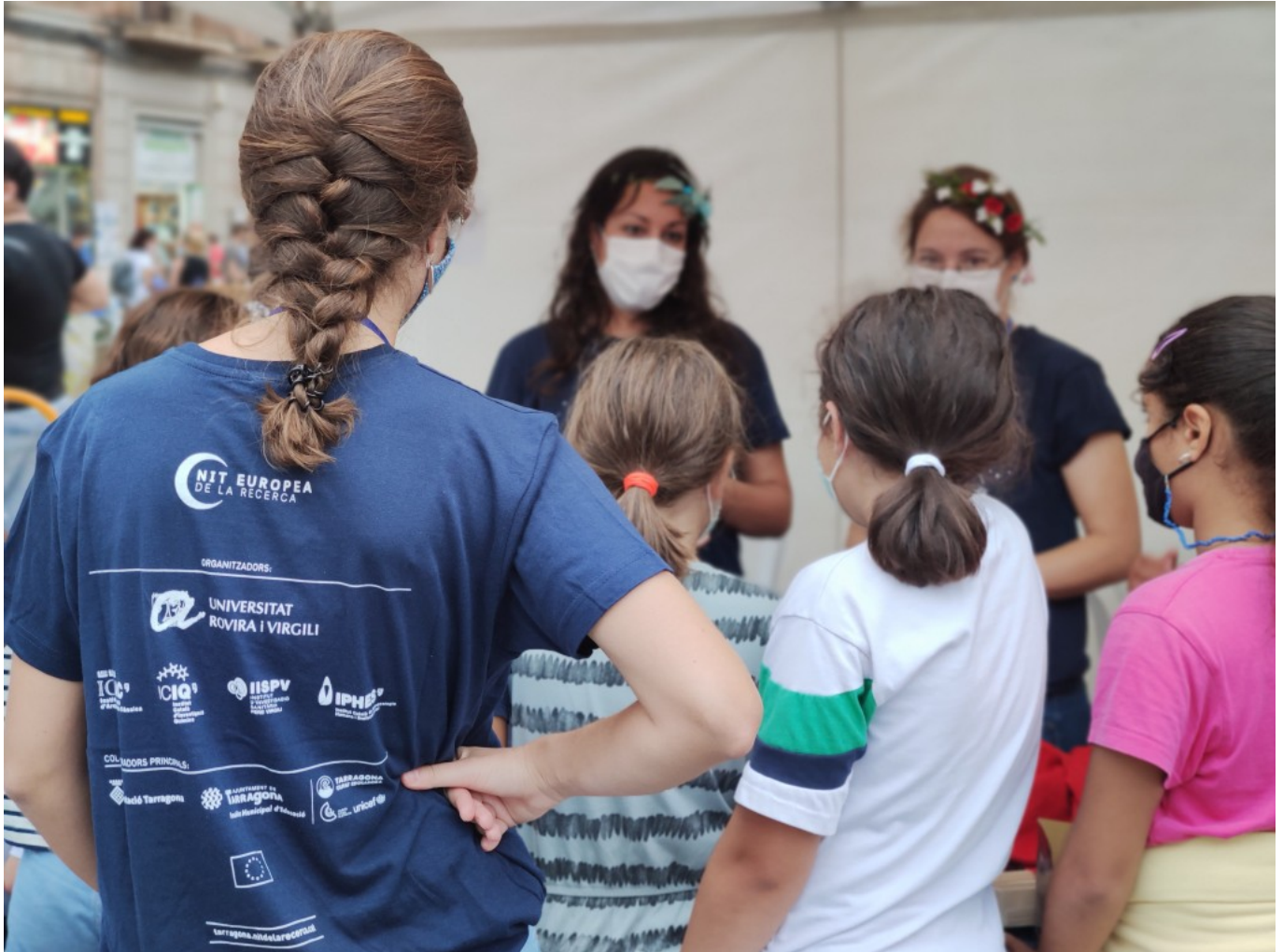
Imatge d'un taller divulgatiu de l'ICAC a la Nit de la Recerca, edició 2021.