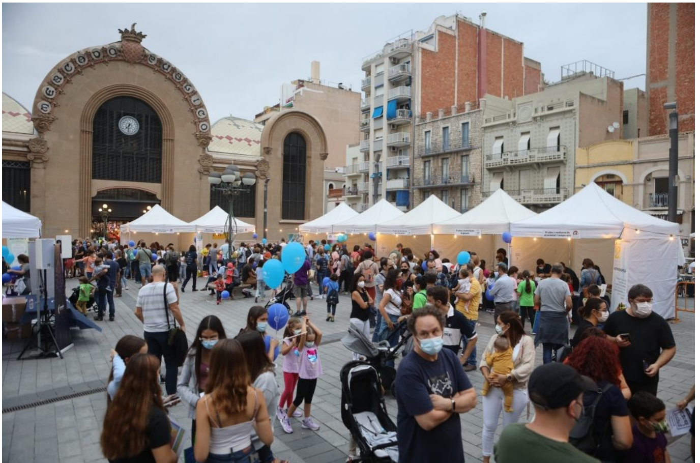
Imatge de la plaça Corsini durant la celebració de la Nit Europea de la Recerca 2021.

L'Ajuntament de Tarragona, a través de l'oficina Europe Direct Tarragona , és el patrocinador principal de l'activitat de la plaça Corsini, juntament amb la Diputació de Tarragona . També ha comptat amb la col·laboració del Mercat Central de Tarragona i l'empresa Borges.