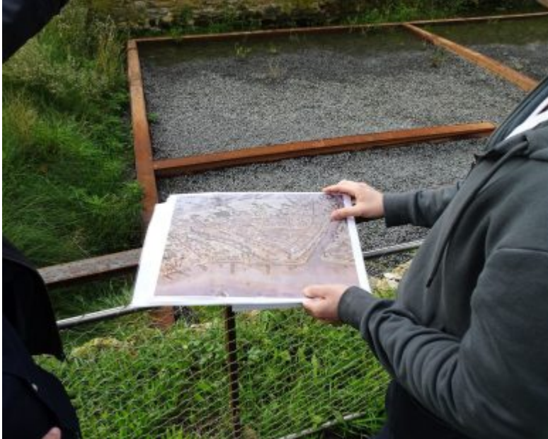
Visita a les restes arqueològiques de Lattara (Musée Henri Prades, Lattes, Hérault).

Aquesta estada de recerca és possible gràcies a una ajuda de mobilitat del Ministeri de Ciència, Innovació i Universitats , destinada a investigadors del programa FPU per complementar la seva formació acadèmica.