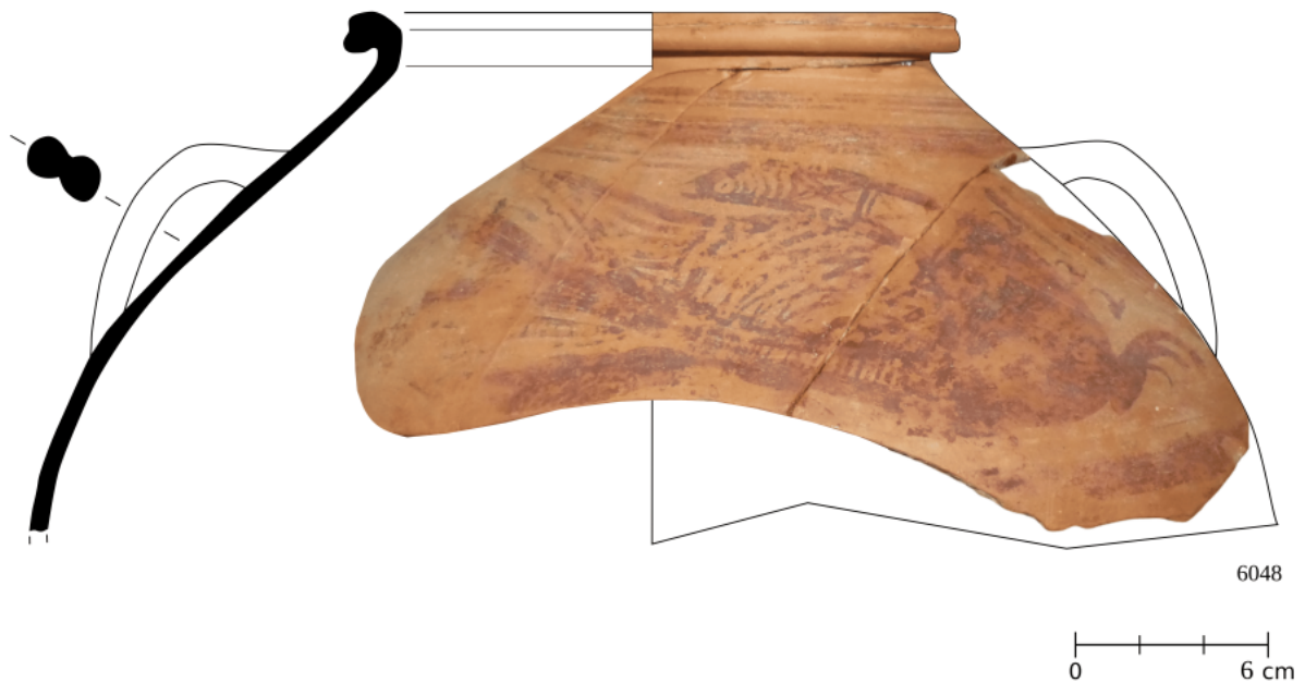
Figura 18. 6048: vasija de tinaja de cuerpo ovoide con asas verticales geminadas, decorada con figura de ave con las alas explayadas y la cabeza girada.