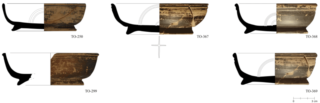
Figura 41. Cuencos de Lamb. 1 / F2320, 2361 de ceràmica campaniense B calena en su fase tardía.

Per a més informació, poseu-vos en contacte amb Publicacions ICAC a través del nostre lloc web o seguïu-nos a les xarxes socials (@ICAC_cat / @icac_cat) per a actualitzacions sobre les nostres publicacions.