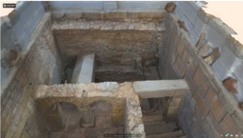
Captura d'imatge del model tridimensional ubicat a Sketchfab.

Gràcies a la plataforma internacional Sketchfab, coneguda com el "youtube dels models 3d", es pot navegar per models de realitat virtual elaborats per la Unitat de Documentació Gràfica de l'ICAC. D'aquesta manera es poden visitar les restes d'un monument que per diferents motius no sempre ha estat a l'abast de tothom.