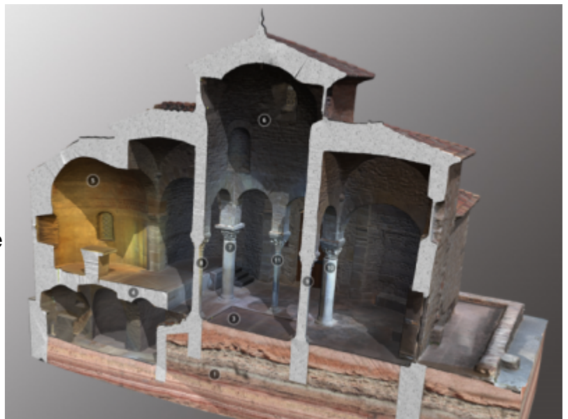
Secció longitudinal de l'església de Sant Miquel i de la

A més dels models tridimensionals, són visibles seccions arquitectòniques amb informació semàntica incorporada. També hi ha inclosos enllaços a les referències bibliogràfiques més significatives, de forma que s'estableix una "finestra de coneixement" permanent i actualitzada que combina la informació científica amb la visualització de models digitals que reproduïxen la realitat arquitectònica com és avui.