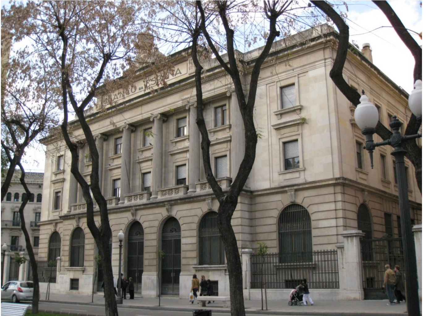
Antic edifici del Banc d'Espanya, Rambla Nova de Tarragona