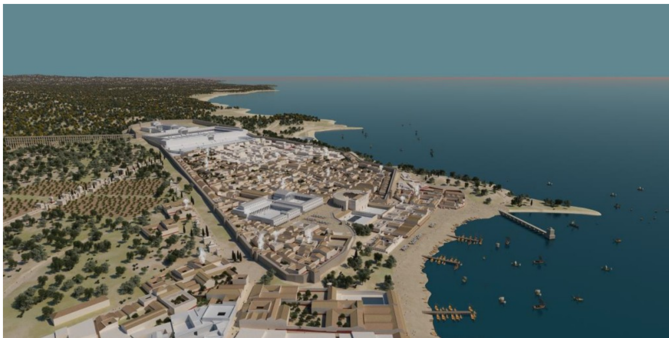
Recreació virtual i en color de la ciutat de Tarraco (fase treball). Imatge: SETOPANT (URV-ICAC)

L'ICAC, com en edicions anteriors, hi participa en diferents activitats. Enguany ha reforçat el seu paper assessor, amb la col·laboració del grup de recerca SETOPANT (URV-ICAC). La col·laboració ha consistit, fonamentalment, en un treball de recreació virtual del fòrum de Tarraco que s'exposarà en les activitats de divulgació històrica del festival. És una manera d'apropar l'expertesa de l'ICAC i el SETOPANT en l'ús de la realitat virtual per al coneixement i divulgació del patrimoni . En aquest cas, al voltant de l'arquitectura i urbanisme de l'antiga Tarraco .