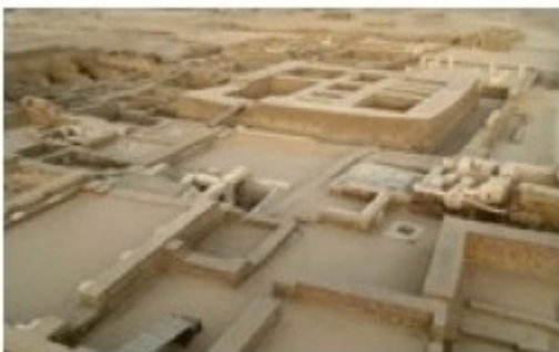
Tebtunis, una ciutat trobada (VO FR / VS CAST, 26')

Què passaria si una jove arqueòloga es trobés amb un fantasma del passat, un romà que pogués transmetre en primera persona com es vivia fa dos mil anys a la ciutat d'Aventicum (Suïssa)? S'establiria un apassionant diàleg per a parlar dels principals monuments de la ciutat, les restes epigràfiques, els mosaics o les termes.