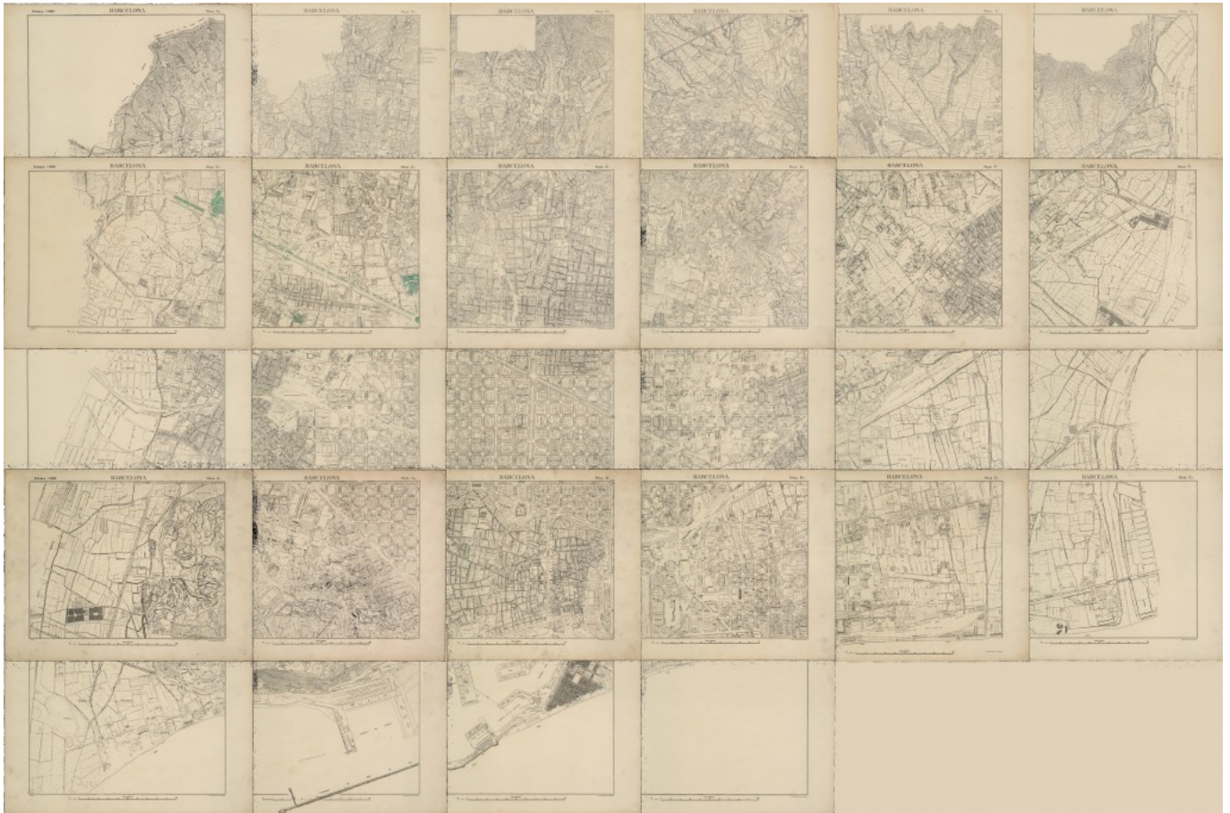
Base cartográfica de V. Martorell de los años treinta georeferenciada.

Se ha desarrollado un trabajo interdisciplinario centrado en aspectos morfológicos, históricos y naturales del paisaje en la ocupación y explotación de la montaña, y su transformación a lo largo del tiempo. En un trabajo de este tipo ha sido importante la incorporación de nuevas tecnologías digitales en el análisis arqueomorfológico , en concreto, Sistemas de Información Geográfica (SIG).