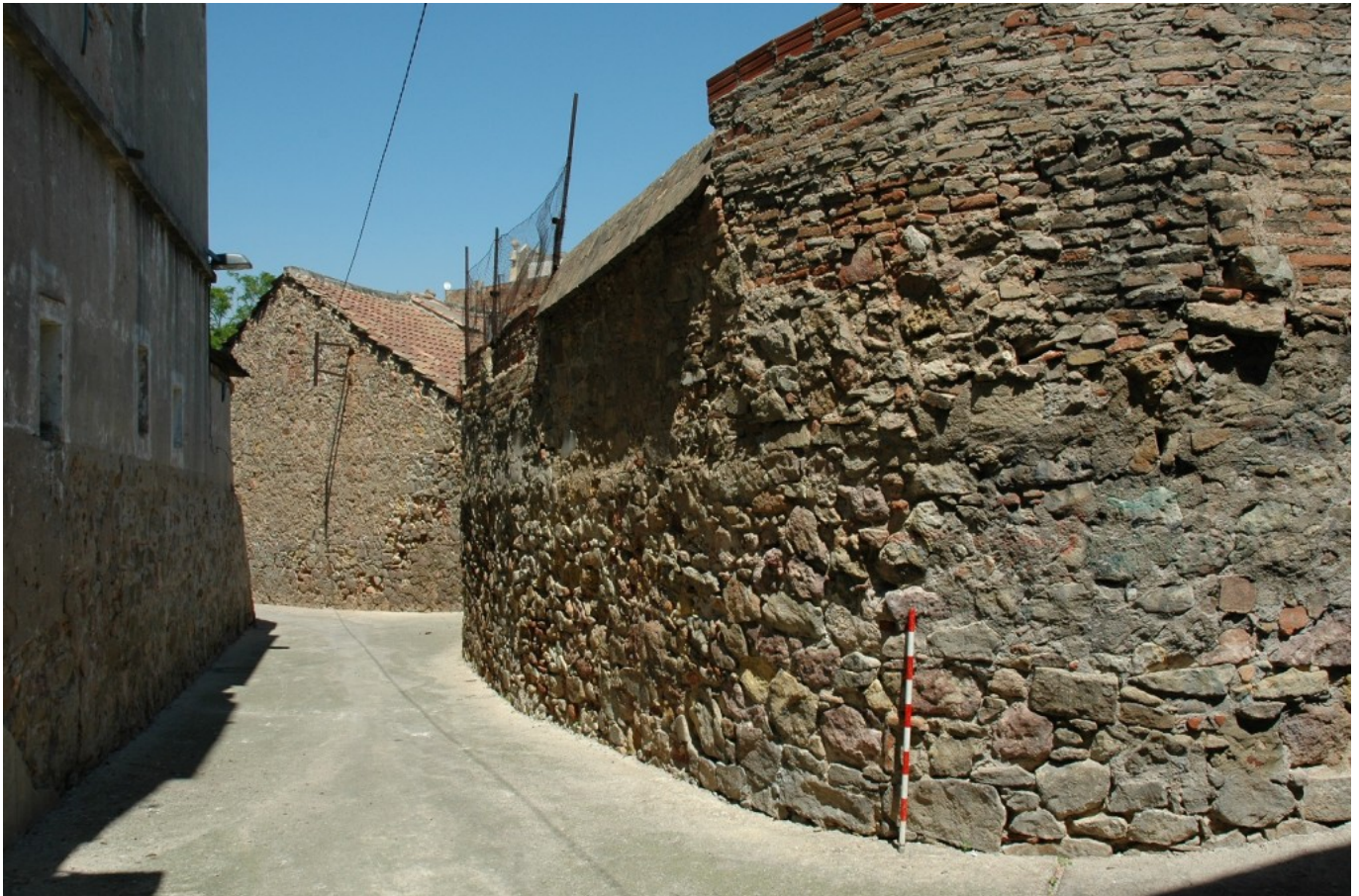
La Satalia, pasaje Antic de València.

El trabajo permitió proponer el emplazamiento exacto de la iglesia de Sant Julià , una importante parroquia alto-medieval actualmente desaparecida situada en la montaña de Montjuïc, e identificar distintas canteras, como las que hay en los jardines del Palacio Albéniz o la de Laribal, en los jardines del mismo nombre. El frente de la cantera Machinet, en el Teatre Grec, es el más conocido en este sector de la montaña, ya que se aprovechó como frente escénico del teatro.