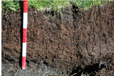
Mostra de torba d'Aigols Podrits (esquerra) i mollera de Coma de Vaca.

Prospecció a la muntanya de Coma de Vaca.