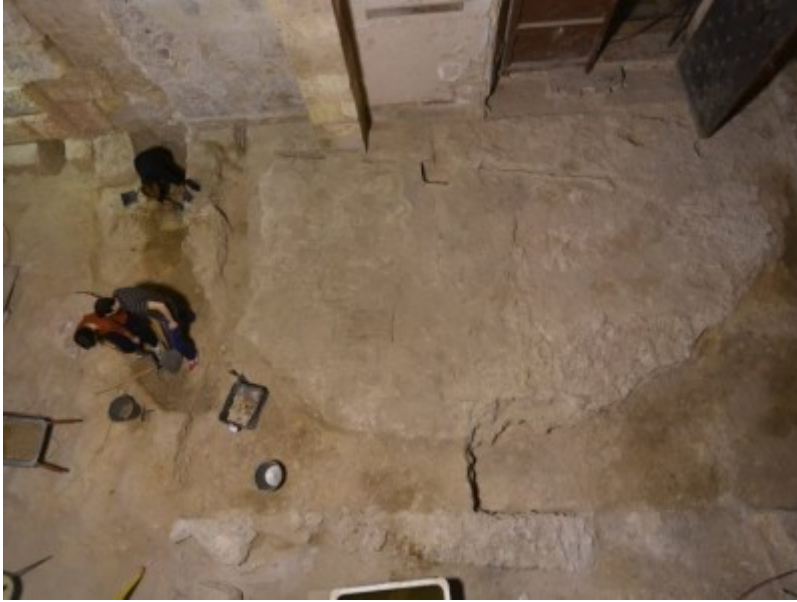
Imatge zenital de l'exedra romana del Claustre de la Catedral de Tarragona.

La iniciativa és una activitat de difusió en el marc dels projectes següents: