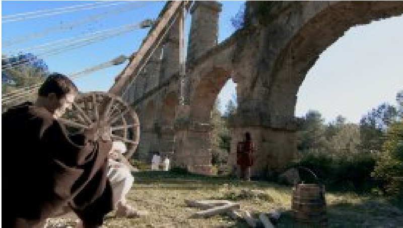
Un momento del documental Acueductos romanos I (...)