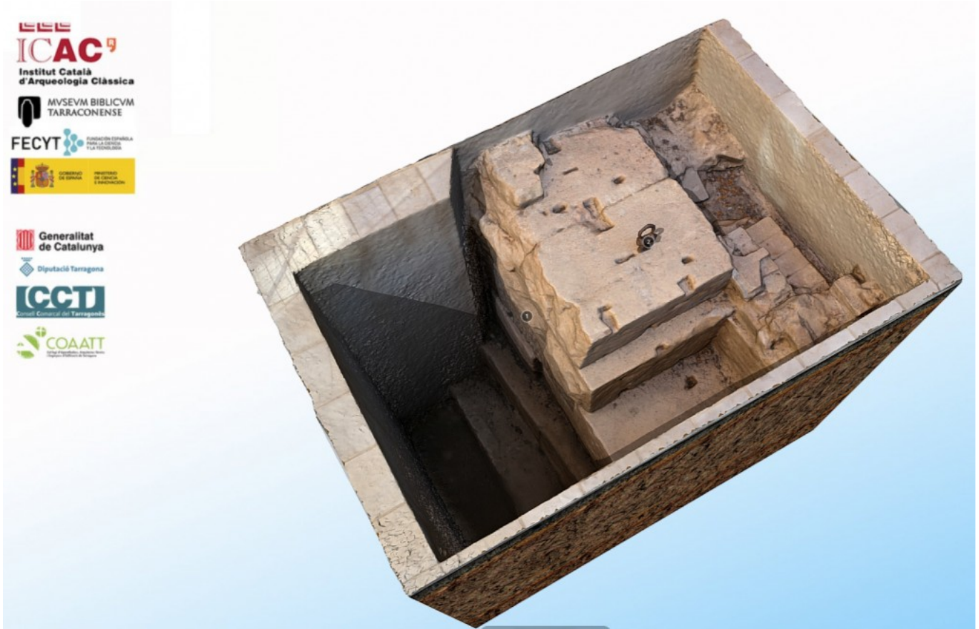
Modelo 3D de los cimientos del muro del recinto de culto imperial.

La nueva colección de modelos tridimensionales es una de las actividades del proyecto “TarrAcro-Polis: un viaje científico de 2.000 años de Historia”, promovido por el Museo Bíblico Tarraconense y el Instituto Catalán de Arqueología Clásica. Es una acción de museografía virtual que sirve de apoyo a la próxima inauguración (el 14 de diciembre) de un espacio de interpretación permanente a las instalaciones del Museo Bíblico Tarraconense.