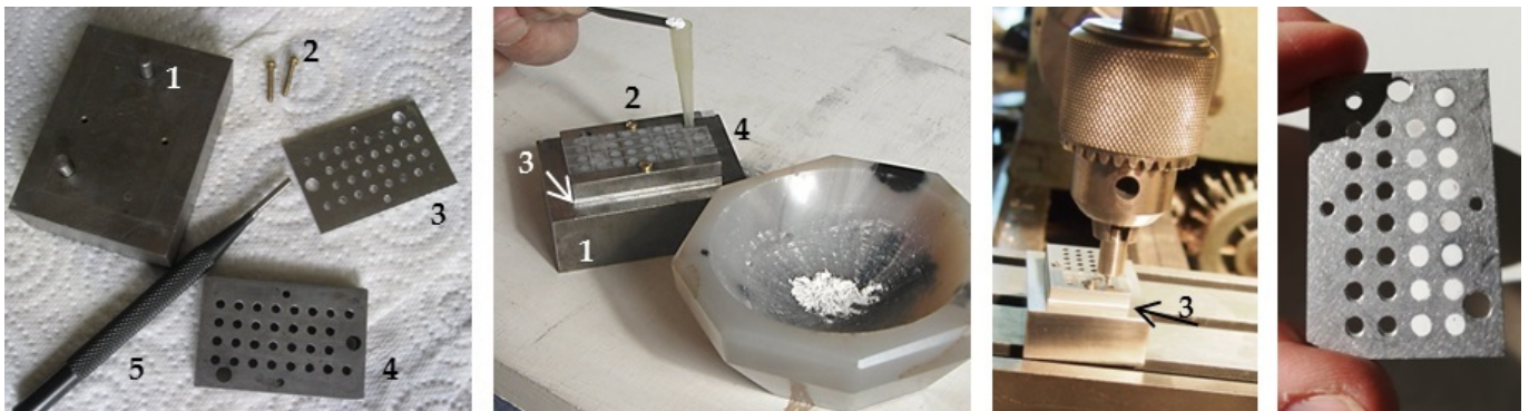
Secuencia de la preparación de muestras para el análisis CL-cuantitativo, desarrollada por Ph. Blanc en la UPMC de París

El nuevo método consiste en la preparación de muestras del mármol en polvo, que acto seguido se colocan en una placa específicamente diseñada para poder ser prensada e introducida en el microscopio electrónico de rastreo (SEM) con un espectrómetro acoplado. Así, se pueden obtener los espectros específicos y la intensidad de estos espectros para cada una de las muestras.