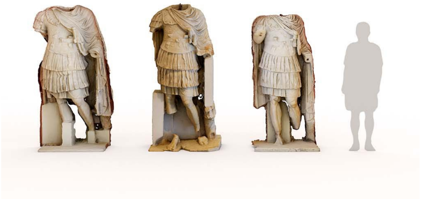
Conjunto de esculturas recuperadas del entorno del Teatro

Puntos de interés: Altar dedicado al culto imperial, Marmolización, Ciclos escultóricos, Fachada posterior, Fachada escénica, Elementos arquitectónicos, Ninfeo, Tribunus, Muros radiales, Restos conservados, Velum.