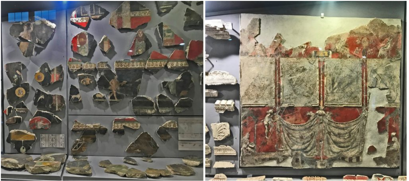
Paneles con elementos figurativos y decorativos procedentes de la colección Gorga alojada en el Museo Palazzo Altemps en Roma.

decoraciones arquitectónicas, sobre todo en revestimientos. Este uso es relevante y proporcionaba valor añadido a los elementos arquitectónicos.