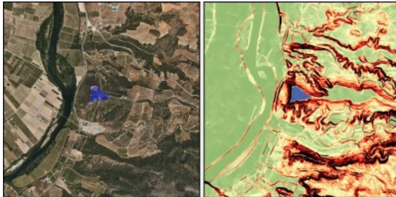
Ejemplo de aplicación GIS al estudio de fortificaciones. Castellet de Banyoles de Tivissa.