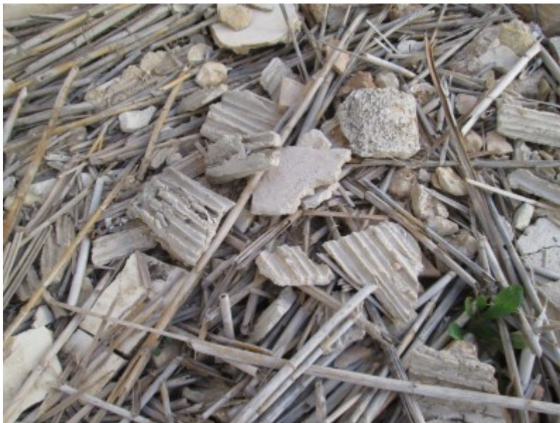
Restos constructivos en una construcció reciente