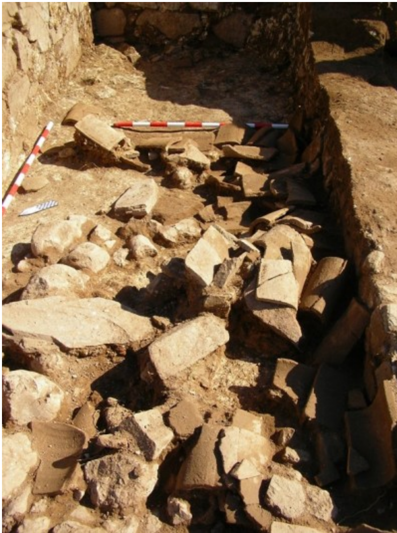
Derribo de tejas de Can Tacó.