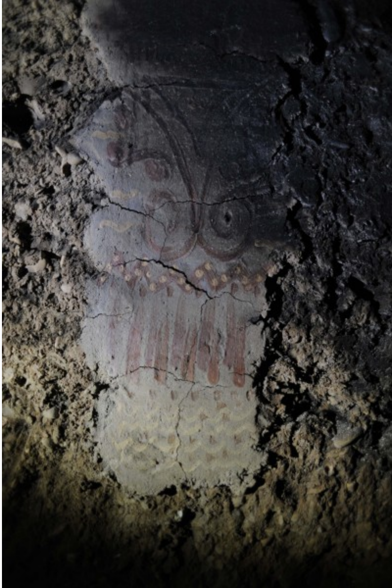
Experimento de quema de una pared de tierra con revestimiento de barro y decorado con pinturas (Burning down a cob wall with mud straw plaster and paintings). Ragewitz, Saxony-Anhalt, 2013.