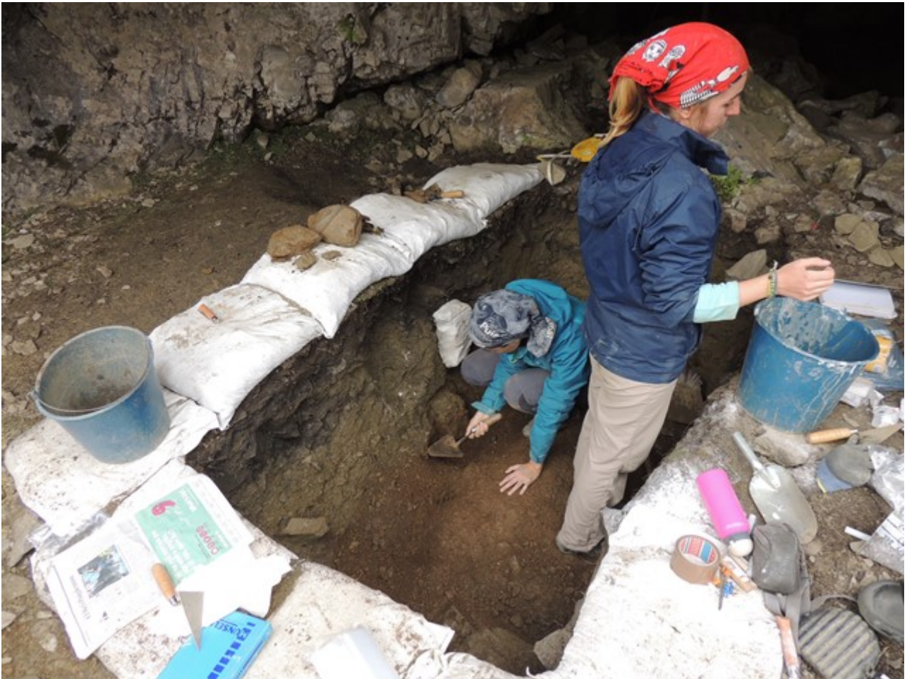
Trabajos geoarqueológicos en la cueva prehistórica del «Catau de l'Os», en el «Forat de l'Embut» (Queralbs, Ripollès).

como la caracterización de la evolución diacrónica de la ocupación del territorio, desde la Prehistoria hasta nuestros días.