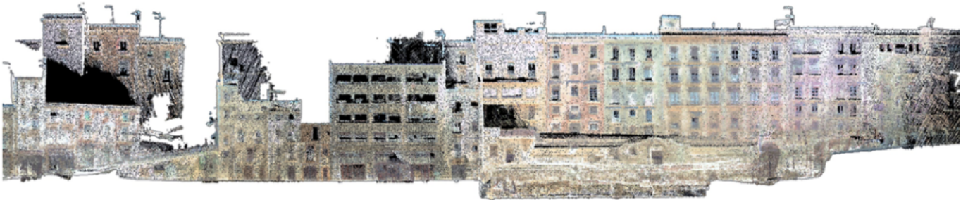
Reconstrucción tridimensional de la calle de Trinet Vell (Tarragona).

Más información sobre la publicación aquí .