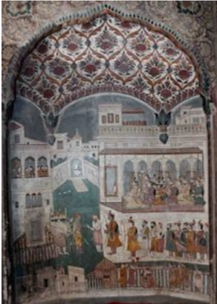
Fig. 12 Parashurama Confronts Rama, episode from the Ramayana, detail from a mural in the Burj temple, Jammu, c. mid-19th century