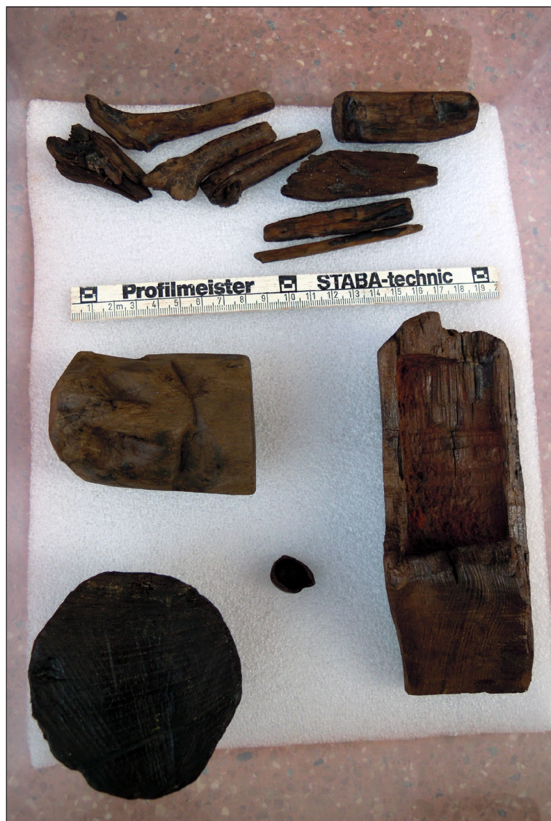
Figura 4. Piezas de madera recuperadas del depósito votivo documentado en el solar nº 27 de la c/ Vidal i Barraquer.

a un sistema de terrazas, con muros de contención, también relacionados con a una nave portuaria (MESAS et al. 2010).