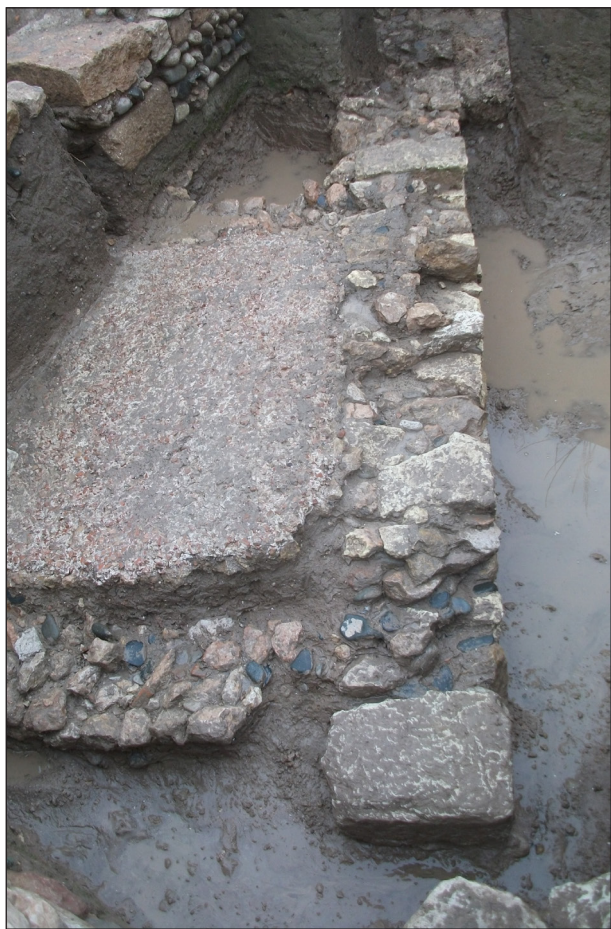
Figura 5. Balsa/depósito con revestimiento de cocciopesto y paredes de piedra y arcilla reforzadas con sillares documentado en el solar nº 27 de la c/ Vidal i Barraquer.