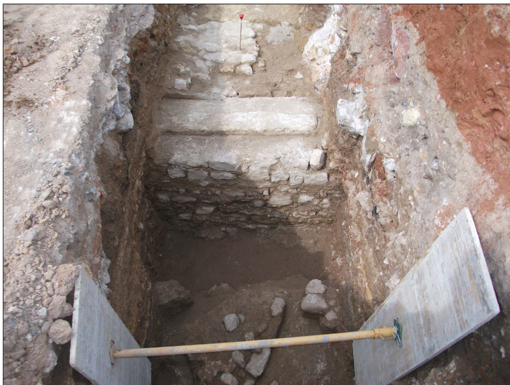
Figura 3. Detalle de los muros de opus incertum/opus caementicium y opus caementicium documentados en la zanja 200 de la UA 15.

aC. (CABRELLES 2004). Hemos de añadir, en nuestro caso, la presencia de nuevas construcciones, asociadas a reformas de esta misma fase, como un muro de cantos y arcilla, y pavimentos de tierra batida y cantos rodados.