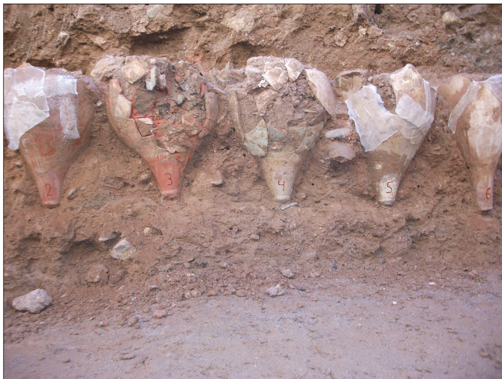
Figura 2. Detalle del sistema de drenaje con ánforas documentado en la zanja 100 de la UA 15.

estructura de drenaje realizada con alineaciones de bases de ánforas. Concretamente se documentaron hasta trece ánforas púnicas 4 , cortadas por el cuerpo en el tercio inferior y apoyadas sobre los pivotes (fig. 2). Este tipo de soluciones en la adecuación de zonas inestables de playa o bien en zonas fluviales, como sistemas de drenaje y para dar estabilidad en zonas portuarias cuenta con numerosos paralelos, como los de Sancti Petri en San Fernando (BERNAL 2005), los del puerto fluvial de Zaragoza (CEBOLLA BERLANGA et al. 2004; GASCÓN et al. 2011), o los del norte de Italia y del sur de Francia (LAUBENHEIMER 1995; VECCHIONE 2010). De hecho, en Arlés y Narbona encontramos ejemplos idénticos al nuestro y fechados en el siglo I aC., usados como sistemas de saneamiento y drenaje en terrenos junto al Ródano y el Aude (VECCHIONE 2001, fig. 3 a 5 y 7).