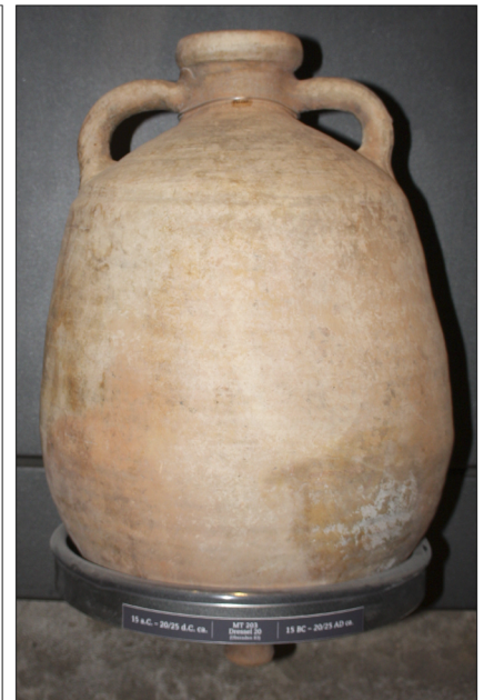
Figura 1. Dibujo y fotografía del ánfora MT 203.